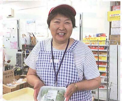
▲もち類、漬物など、さまざまな加工品を出荷しています。