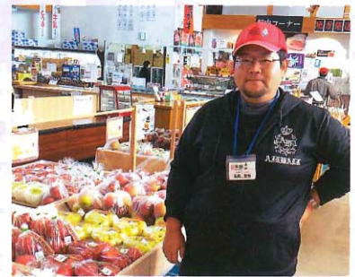
▲おいしいりんごをお届けします!

家族でりんご栽培を行い、来夢くんへ出荷しています。 管理をしっかりしておいしいりんごを消費者の皆様にお届けしています。 これからも、お客様に喜ばれるように家族で協力して、奥州りんごを広 めていきたいと思ひます。是非、来夢くんに来てください!