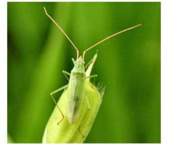
アカヒゲ成虫 体長5~6mm