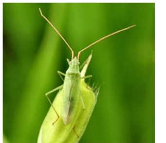
アカヒゲ成虫 体長5~6mm

注意!! 出穂期が早まった場合、カメムシ剤の散布時期も早まりますので、ミツバチへの農薬危被害対策として、周辺の養蜂家への通知、御配慮の徹底をお願いします。