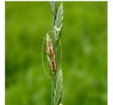
写真 イタリアンライグラスに寄生するアカスジカスミカメ（成虫）