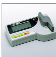
図3: 水分計 ※資材センターで取り扱っております

出穂・開花にバラツキのあった圃場や倒伏した圃場では登熟程度・水分分布に大きな差があります。 手動による高温急激乾燥は、乾燥ムラを引き起こすばかりか、胴割れ粒の発生を助長します。 火力乾燥作業は慎重に行い、胴割れ粒等の発生・品質低下を防ぎましょう!!