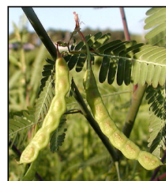
図1: 水田雑草: クサネム