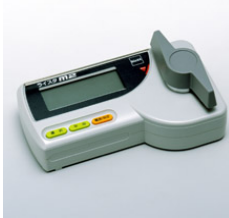
図3:水分計 ※資材センターで 取り扱っております

出穂・開花にバラツキのあった圃場や倒伏した圃場では登熟程度・水分分布に大きな差があります。手動による高温急激乾燥は、乾燥ムラを引き起こすばかりか、胴割れ粒の発生を助長します。火力乾燥作業は慎重に行い、胴割れ粒等の発生・品質低下を防ぎましょう!!