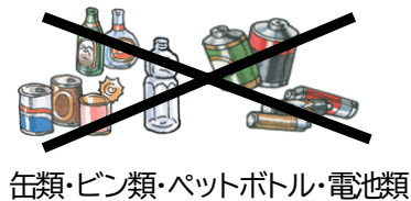
缶類・ビン類・ペットボトル・電池類