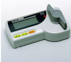
図3：水分計 ※資材センターで 取り扱っております

出穂・開花にバラツキのあった圃場や倒伏した圃場では登熟程度・水分分布に大きな差があります。 手動による高温急激乾燥は、乾燥ムラを引き起こすばかりか、胴割れ粒の発生を助長します。 火力乾燥作業は慎重に行い、胴割れ粒等の発生・品質低下を防ぎましょう!!