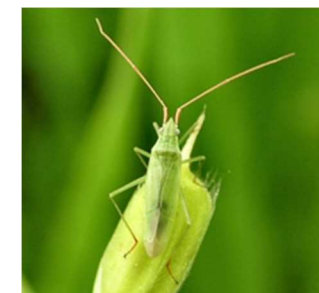
アカヒゲ成虫 体長5～6mm

※水田雑草(ヒエ・ホタルイ・シズイ)が多い場合、薬剤防除前に抜き取りをしましょう。