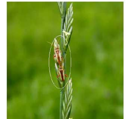
写真 イタリアンライグラスに寄生するアカスジカスミカメ（成虫）