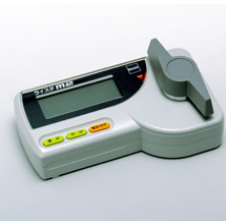
図3: 水分計 ※資材センターで取り扱っております

出穂・開花にバラツキのあった圃場や倒伏した圃場では登熟程度・水分分布に大きな差があります。 手動による高温急激乾燥は、乾燥ムラを引き起こすばかりか、胴割れ粒の発生を助長します。 火力乾燥作業は慎重に行い、胴割れ粒等の発生・品質低下を防ぎましょう!!