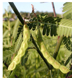
図1: 水田雑草: クサネム