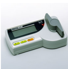
図3: 水分計 ※資材センターで取り扱っております

出穂・開花にバラツキのあった圃場や倒伏した圃場では登熟程度・水分分布に大きな差があります。 手動による高温急激乾燥は、乾燥ムラを引き起こすばかりか、胴割れ粒の発生を助長します。 火力乾燥作業は慎重に行い、胴割れ粒等の発生・品質低下を防ぎましょう!!