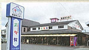
▲産直センター菜旬館です。